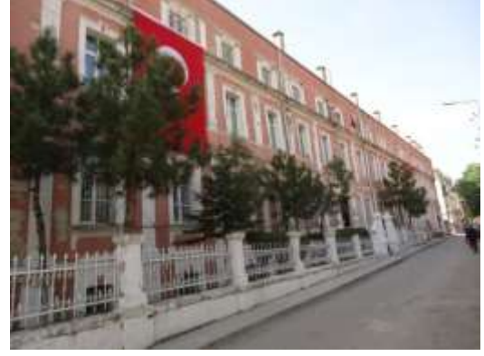
Şekil 6. Uzun blok İzmir Caddesi cephesi

Bodrum katın düzenli bir planı yoktur. İzmir Caddesi üzerindeki uzun bloğun altında bugün kalorifer dairesi, mescit, çalışma atölyeleri ve bunları birbirine bağlayan uzun bir koridor vardır. Bodrum kat pencereleri mazgal tipi pencerelerden ışık almaktadır. Üst kattaki pencereler özgün formlarını korumuş olsalarda bazı değişimler geçirmiştir ancak yine de plasterlerle bölümlenmiş cepheleriyle binanın yine de etkileyici bir görünümü vardır. Cephe görünümünde katları ayıran silmeler dikkat çekicidir. Bunların en göz alıcı olanı, çatı katını vurgulamak üzere dışarı uzatılmış silmedir. Yapı bu hâliyle bir Rönesans sarayını andırmaktadır.