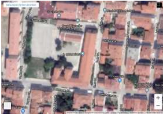
Şekil 1. Google Earth'te 1. Murat Lisesi

Yapının bugünkü yer tanımlaması şöyledir: Bina Kaleiçi'nde, İzmir Caddesi ve Balık Pazarı Caddesinin kesiştiği noktada yer almaktadır. İzmir Caddesi üzerinde yer alan uzun cephenin ve Balık pazarı caddesinde yer alan kısa cephenin karşısında ise bu yapı adasını kapatan “L” formundaki Kemer Avlu Sokağı vardır. Bu ada sınırları içinde “L” formundaki okul binası ve bu formun “U” şeklinde algılanmasını sağlayan Katolik Kilisesi (Bugün konferans salonu) vardır. “L” formundaki binanın kısa kol ucunun yanı başında müdür lojmanı olarak kullanılan yakın tarihli bir konut yapısı vardysa da bugün yoktur, yıkılmıştır. (Şekil 1-2)