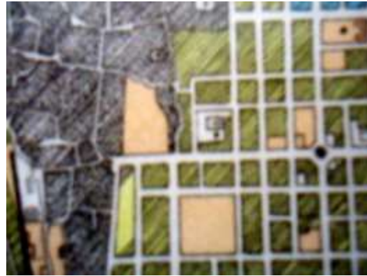
Şekil 2. Edirne Planında (1918) 1. Murat Lisesi

Koruma Kurulunda baktığımız Araştırma-Proje dosyasındaki restitüsyon raporuna göre “L” formundaki binanın iki ayrı blok olarak farklı zamanlarda yapıldığı ve sonradan birleştirildiği ileri sürülmektedir. Oysa ulaşabildiğimiz tüm eski fotoğraflarda iki blok birleşik görülüyor. Dahası yer tarifi yaptığımız köşede iki bloğu birbirine bağlayan kule benzeri bir yapı algılanıyor. (Şekil 3-4)