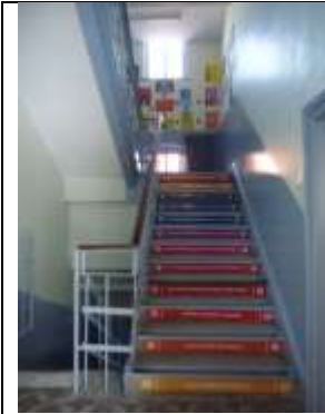
Şekil 7. Uzun Blok

Giriş katının uzun bloğunun yerleşimi 1 ve 2. kattan biraz farklıdır. Burada caddeye bakan yönde farklı işlevlere sahip odalar (ofisler, sınıflar, öğretmenler odası, kantin, tuvaletler) sıralanırken avluya bakan yönde, bir yanı kemerli bir portikle dışa açılan geniş bir koridor vardır. Portiği oluşturan kemer boşlukları bugün cam bölmelerle dışa kapatılmış durumdadır ki eski resimlerde dahi bu kemer boşluklarının kapalı olduğu görülür. Geniş koridor iki bloğun birleşim yerinde daralarak, kısa bloğun sonundaki merdivenlere kadar uzanır. Koridorun caddeye bakan yönünde sınıflar yer alır. (Şekil 8)