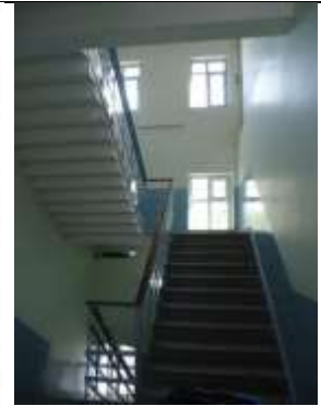
Şekil 9. Kısa Blok