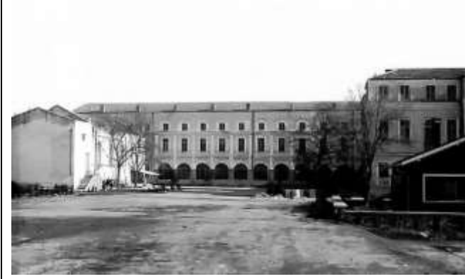
Şekil 5. Avludan uzun blok, sağda müdür lojmanı