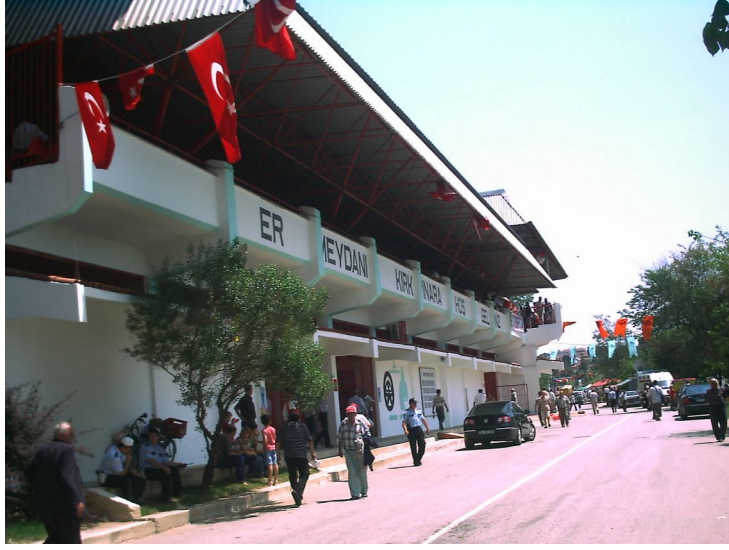
Sarayıçi Er Meydanı Kırkpınar Stadı