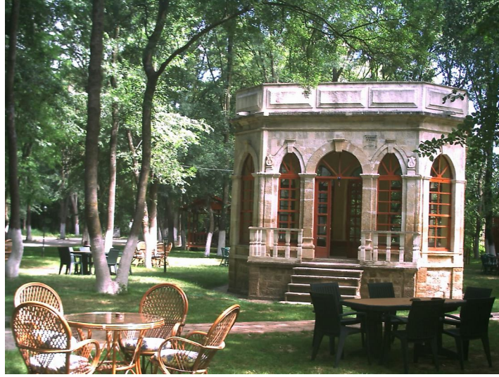
IV. Avcı Mehmed’in Av Köşkü

zamanında yaptırılan İftar Köşkü’nden (1663) bugün için hiçbir iz kalmamıştır. 10 Hadika-i Hassa içine Osmanlı Devleti döneminde yaptırılan Fatih Sultan Mehmed’e ait Bönce Köprüsü (1452) ve 11. Padişah Kanuni Sultan Süleyman (1566-1574) tarafından Mimar Sinan’a yaptırılan Saray Köprüsü (1553), çeşitli yıllarda tamir ve onarımlardan geçirilerek bugünlere ulaştırılmıştır. 11 Yine Kanuni Sultan Süleyman tarafından yaptırılan Adalet Kasrı 12 (1561) ile IV. Avcı Mehmed tarafından yaptırılan Av (Bülbül) Köşkü (1671) o günlerden bugünlere gelebilen ender tarihî eserlerimizdendir.