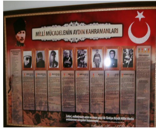
Aydın'da İstiklal Madalyası kazanmış kahramanlar 20